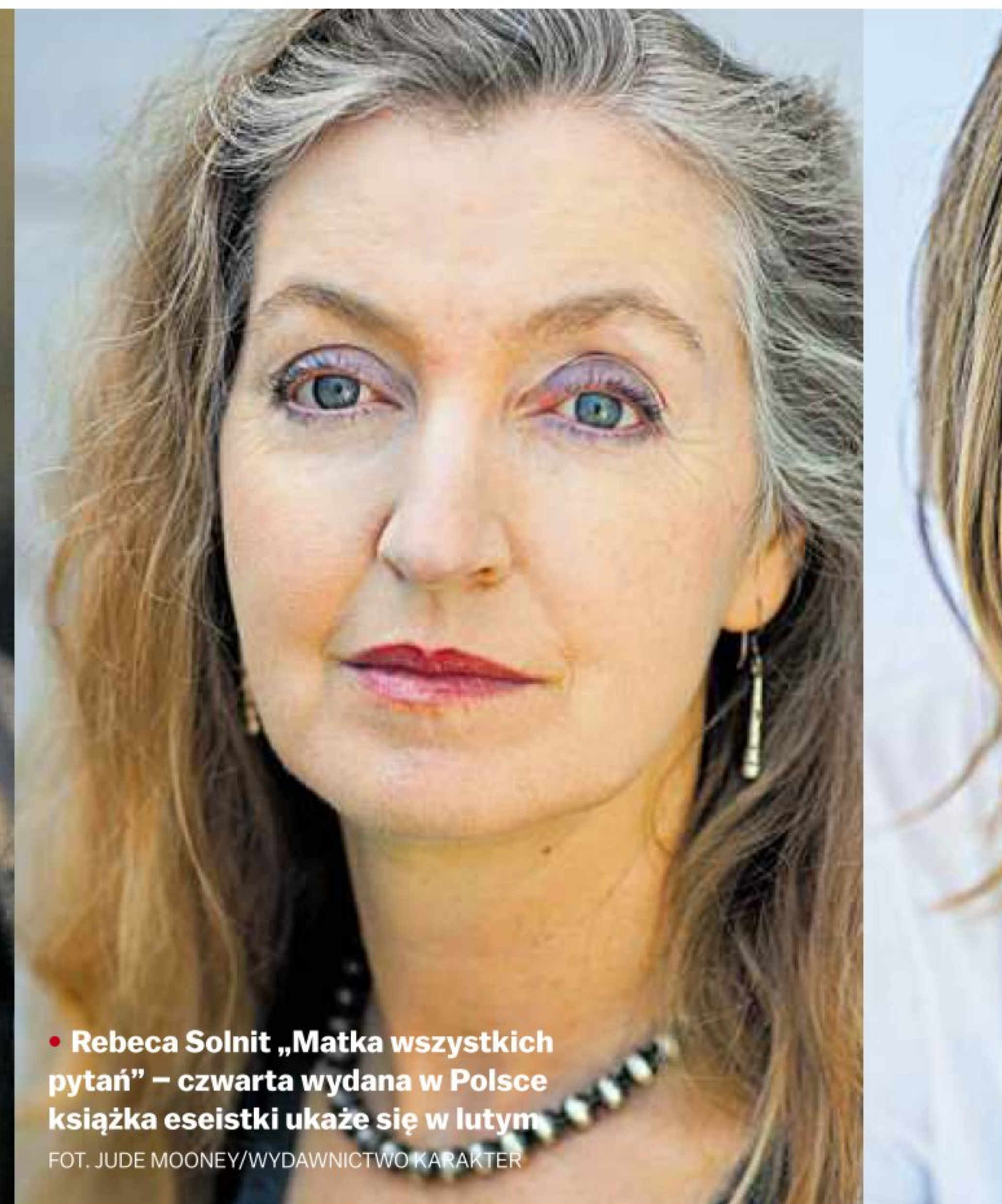
• Rebeca Solnit „Matka wszystkich pytań” – czwarta wydana w Polsce książka eseistki ukaże się w lutym

jej ojca, prezydenta Salvadora Allende. To historia trzech pokoleń rodziny Trueba i zachodzących – nierzadko brutalnie – zmian społecznych.