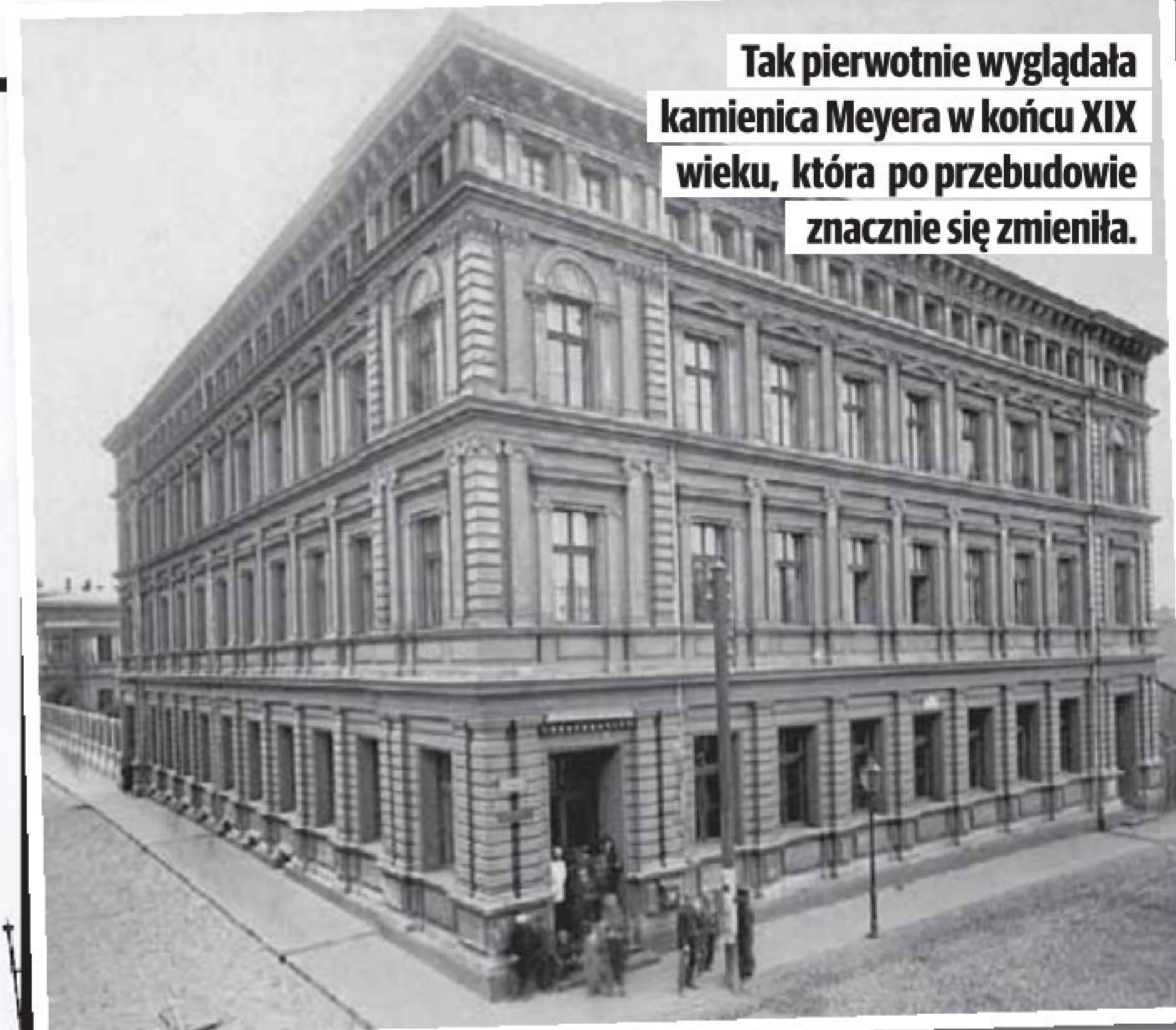
Tak pierwotnie wyglądała kamienica Meyera w końcu XIX wieku, która po przebudowie znacznie się zmieniła.